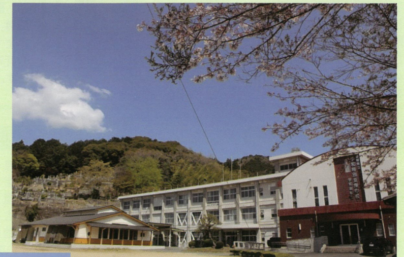
聴覚障がい部門・肢体不自由部門

地域社会の未来を自分らしく生き抜く力の育成 ～瞳輝き、心つながる自己実現を目指して～