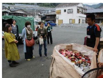
浜っ子作業所 様（就労継続支援 B 型事業所）