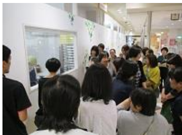
チャレンジド・ラボ 様（生活介護事業所）