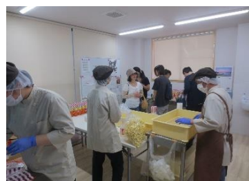
Kitchen 夢彩 様（就労継続支援 B 型事業所）