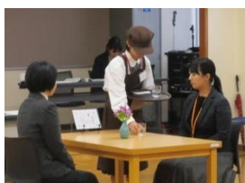
接客サービス部門(喫茶サービス)