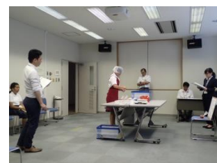
販売実務サービス(商品化)