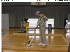
清掃サービス部門(ダスタークロス)