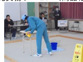
清掃サービス部門(机拭き)