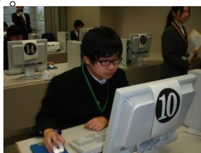
情報サービス部門

○平成31年1月19日(土)「愛顔のえひめ特別支援学校技能検定(南予地区第5回)」(清 掃サービス部門)受検者12人(実施会場:宇和特別支援学校(知的障がい部門))「技能検 定」の結果、県検定6人、地区検定8人が見事1級を取得しました。(1級認定者は「学校 新聞」に記載しています。)今回は第10回技能検定と第5回南予地区検定の様子を紹介し ます。