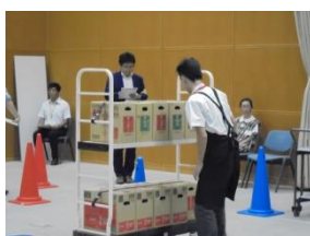
販売実務サービス部門(運搬・陳列)